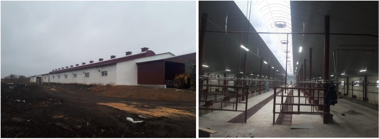
Реконструкция здания коровника в СПК «Белокуриха» (Алтайский район)

В целях создания единой модели сопровождения кооперативного движения по принципу «одного окна» в Алтайском крае в 2018 году создан Центр компетенций в сфере сельскохозяйственной кооперации («Центр компетенций СХК»). В сферу деятельности Центра компетенций СХК входят образовательные и информационно-консультационные услуги, а также организация дискуссионной площадки.