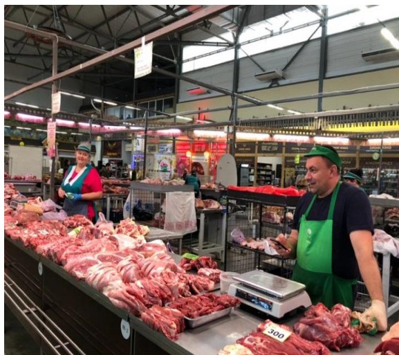
Продукция алтайских сельхозтоваропроизводителей на продовольственных ярмарках края

В 2018 году проведено 2119 ярмарочных мероприятий, что обеспечило возможность приобретения населением продовольственных товаров, в том числе сельскохозяйственной продукции местного производства. Дополнительно содействие в продвижении производимой сельскохозяйственными кооперативами продукции оказано посредством размещения информации на специализированном портале «Алтайские продукты».